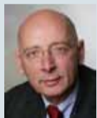
Josef Wieland Leadership Excellence Institute Zeppelin